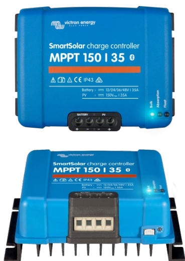
Controlador de carga SmartSolar MPPT 150/35